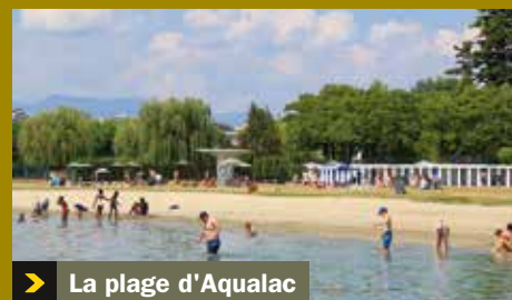
> La plage d'Aqualac

Aix - Aqualac: voir au début de cette rubrique Six autres plages vous accueillent autour du lac: Bourget-du-Lac, Châtillon, Conjux, Lido, Mottets et Pointe de l'Ardre