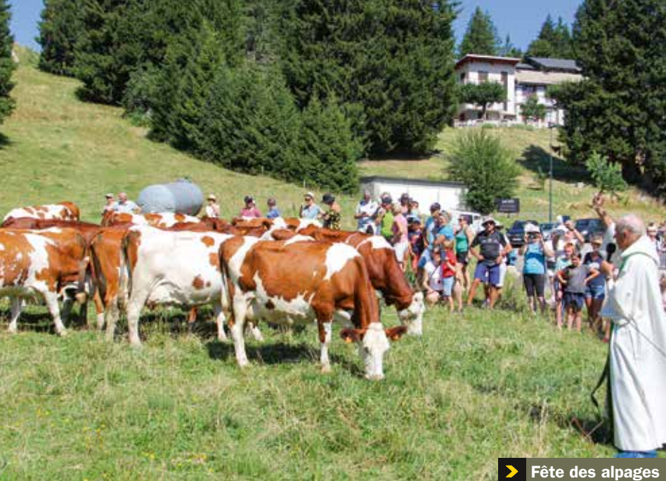
Fête des alpages