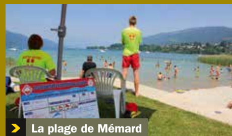
> La plage de Mémard