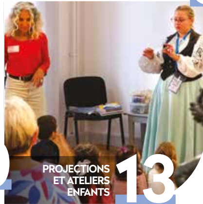
PROJECTIONS ET ATELIERS ENFANTS