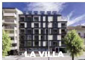
Av. du Petit Port