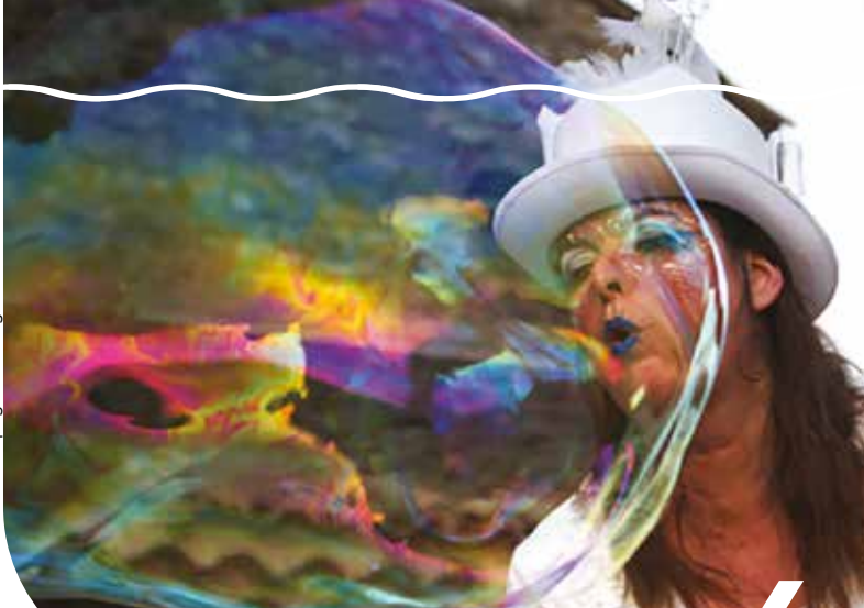
DÉAMBULATIONS « LES BULLES HEUREUSES »