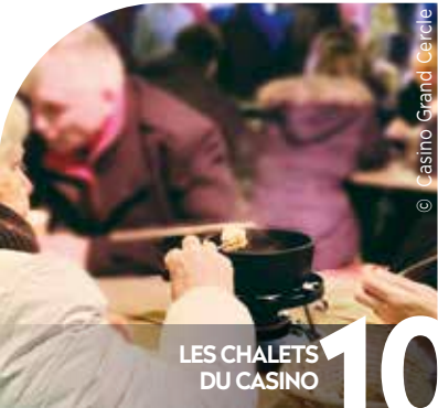
LES CHALETS DU CASINO