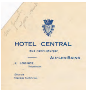
Entête de papier à lettre de l'hôtel Central.

Cette formation fut ouverte en mai 1915, en remplacement des hôpitaux des grands hôtels qui fermaient, mais elle-même fut désaffectée dès octobre 1915. Infirmière : Mme Lognoz.