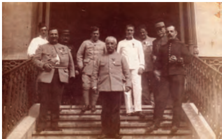
Blessés et soignants du Beau Site.

Une liste de blessés accueillis dans cet hôtel fut publiée le 5/10/1914. Ce site reçoit majoritairement des officiers et sous-officiers.