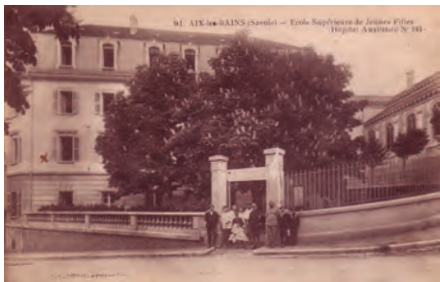
Soldat devant l'HA 105, école supérieure

Cet hôpital auxiliaire est géré par l'Union de Femmes de France. Il reçoit 45 blessés dès le premier train, le 10/9/1914. L'internat de l'école continu de fonctionner, une dizaine de jeunes filles étaient alors hébergées chez la directrice.