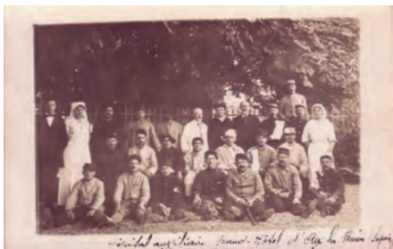
Blessés et soignants du Grand-Hôtel