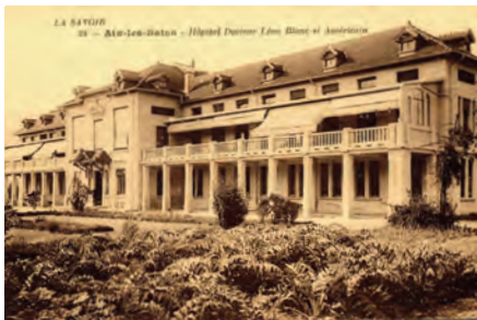
L'hôpital Léon Blanc vers 1914.

Cet hôpital neuf, peu utilisé, est déjà organisé en septembre 1914, avec 25 lits, puis 78 en novembre 1915. Il fonctionne en continu jusqu'au 22 octobre 1917. L'hôpital est ensuite loué à l'armée américaine.