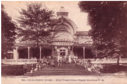
Palais Bristol, hôpital auxiliaire n°10

Dimensionné pour 110 lits, il était divisé en salles : salles Liège, Alsace, Bruyères, Altkirch, St Dié, Montmirail et Mulhouse. Il reçut ses premiers 85 blessés lors du second convoi le 12/9/1914. A partir du 27 novembre 1914 il fut pris en charge par la Société de Secours aux Blessés d'Annecy. Mme Laeuffer, présidente de la Croix-Rouge française dirigeait la formation (1915).