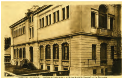
Reine Hortense vers 1914.

Il est géré par l'Union des femmes de France. Il contient 65 lits en septembre 1914, puis 45 lits en novembre 1915. C'était le docteur Léon Blanc qui est attaché à cet hôpital. Il a pour aide les Drs Forestier et Louis Duvernay (en 1914). Il n'a pas de bloc chirurgical et la formation reçoit essentiellement des blessés ayant besoin de soins thermaux.