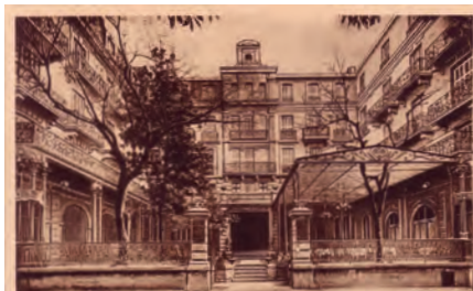
AIX-LES-BAINS (Savoie) - Grand Hôtel du Nord et Grande-Bretagne

Archives lacunaires. Le registre d'entrées est sur le même registre que celui de l'hôpital 169 bis de l'hôtel de Paris. Il ne comprend que 430 noms puis il est interrompu.