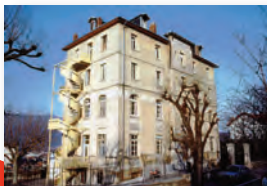
La maison des associations Bernascon