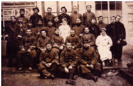
Blessés et soignants du Continental.

Il reçut ses premiers blessés en 1914, la liste en fut publiée le 7 octobre. Il com- portait 25 lits en 1915, puis environ 80. En septembre 1918, il y avait encore 64 blessés. Les listes d'admissions com- prennent essentiellement des officiers et sous-officiers.