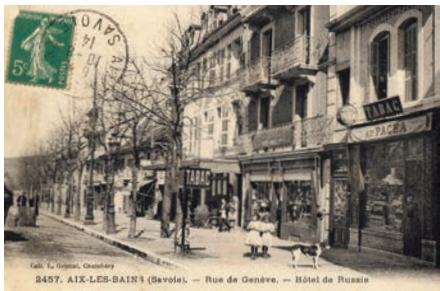
L'hôtel de Russie vers 1914

Cette petite formation fut mise en place début 1915 pour pallier à la fermeture des hôpitaux des grands hôtels. Elle fut cependant fermée le 26/8/1915 pour rationaliser l'offre de soin. Elle ne recevait pas de grands blessés.