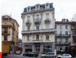
© AC Inventaire du patrimoine d'Aix-les-Bains.