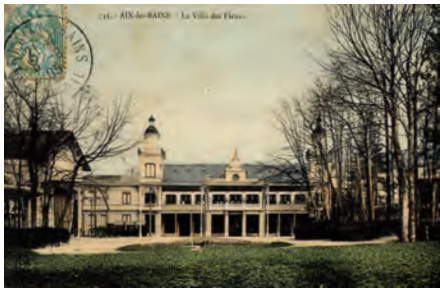
La Villa des Fleurs vers 1910.

La Villa des Fleurs sert d'abord d'annexe à l'hôpital dépôt des convalescents n° 29 du Grand Cercle avant de devenir une annexe de l'hôpital complémentaire n°52 de l'hôtel Métropole. C'est au titre de dépôt de convalescents qu'il reçoit le plus de blessés.