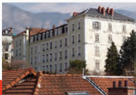
© AC Inventaire du patrimoine d'Aix-les-Bains.