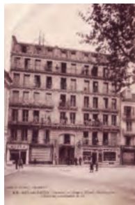
L'hôtel Métropole vers 1915.

Il fut mis à la disposition de l'armée italienne à partir du 19/05/1918 et comportait 200 lits