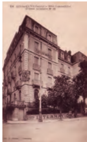
L'hôtel International vers 1915.