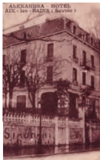
Hôtel Alexandra, rue Marie de Solms.

Cette formation contenait 40 lits. Elle était spécialement aménagée pour les sous-officiers et les officiers. Infirmières, Mmes Gignoux et Michel.