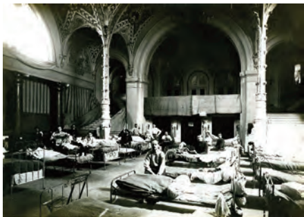
Le foyer du théâtre, fin 1914.

D'abord hôpital bénévole de la ville, le Casino devient hôpital dépôt pour convalescents le 01/12/1914, géré par le Service de Santé des Armées, jusqu'au 1 janvier 1916 où, sur décision du sous-secrétaire d'Etat à la guerre et sous la pression des aixois qui veulent libérer le Casino pour la saison, les convalescents sont transférés à Cognin.