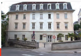
La bibliothèque ex école supérieure