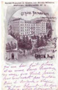
Les Iles Britanniques

Il est ouvert le 6 septembre 1916 suite au transfert de l'hôpital auxiliaire de l'Ecole Bernascon et tenu par la Société de Secours aux Blessés d'Aix-les-Bains. L'hôpital reçoit essentiellement des patients ayant besoin de soins thermaux.