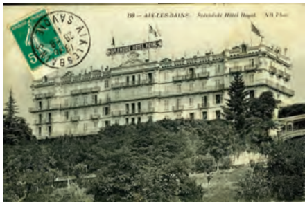
L'hôtel Splendide vers 1914

Cet hôpital reçut 97 blessés dès le premier train, le 10/9/1914. Il ne pratiquait pas la chirurgie et ne recevait que des patients atteints de petites blessures ou malades.