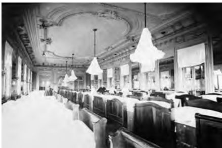
Salle-à-manger de l'hôtel Bernascon.

Des listes de blessés reçus furent publiées du 16/9/1914 au 08/10/1914. En août 1915, l'hôpital contenait 54 lits. On n'y pratiquait pas la chirurgie. Il fut transféré à la villa d'Astay, annexe du Bernascon, en 1915 pour l'ouverture de l'hôtel à la villégiature.