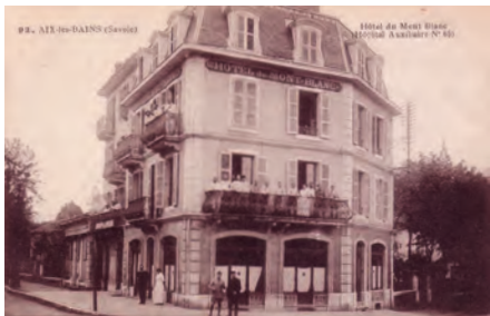
L'hôtel du Mont-Blanc en 1915

Cet hôpital fut créé par la municipalité et géré par la Société de Secours aux Blessés d'Evian. Il ouvre en juillet 1915 à la suite de la fermeture des formations des grands hôtels. Cet hôpital disposait d'un bloc opératoire et prenait en charge les cas grave de l'HA15 (plaies multiples/fracture).