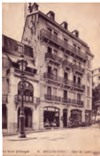
Hôtel du Centre, rue de Chambéry.