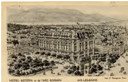
L'hôtel Astoria vers 1914

Lors de la fermeture de l'hôpital, les der- niers malades furent transférés à l'hôpi- tal bénévole du Mont-Blanc. Il semble qu'il était géré sous les auspices de Mme Cunningham Bishop.