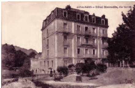
L'hôtel Mercédes, vers 1914.

Il reçut ses premiers blessés dès 1914. La liste en fut publiée le 6/10/1914. Il comportait environ 40 lits.