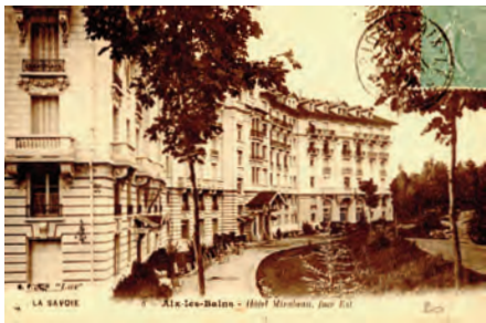
L'hôtel Mirabeau vers 1914