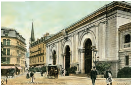
Les thermes Pellegrini, vers 1914.

Cette formation est ouverte par les hospices civils en mai 1915 avec 31 lits, après la fermeture de Reine Hortense. Elle reçoit des blessés ayant besoin de soins thermaux.