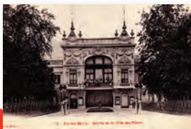
La Villa des Fleurs vers 1910.