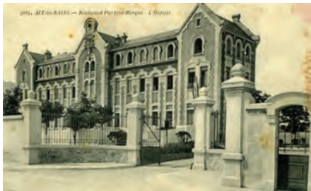
L'hôpital municipal vers 1914.

L'hôpital principal de la ville fonctionne pendant toute la guerre en hôpital militaire, tout en continuant à recevoir les malades civils. Il est le mieux équipé pour les opérations lourdes, réalisées avec l'aide de chirurgiens chambériens (Dr Cleret). La facture récapitulative présentée par la commission des hospices au Service de Santé militaire, en 1918, fait état de 94 710 journées d'hospitalisation.