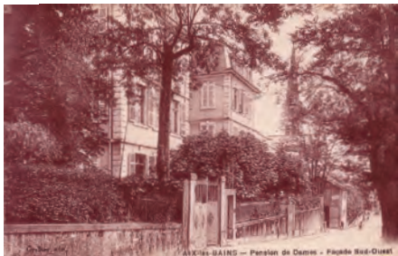
La pension des Dames vers 1914

Médecins et chirurgiens connus ayant pratiqué à cette période : Dr Dardel, mé- decin-chef