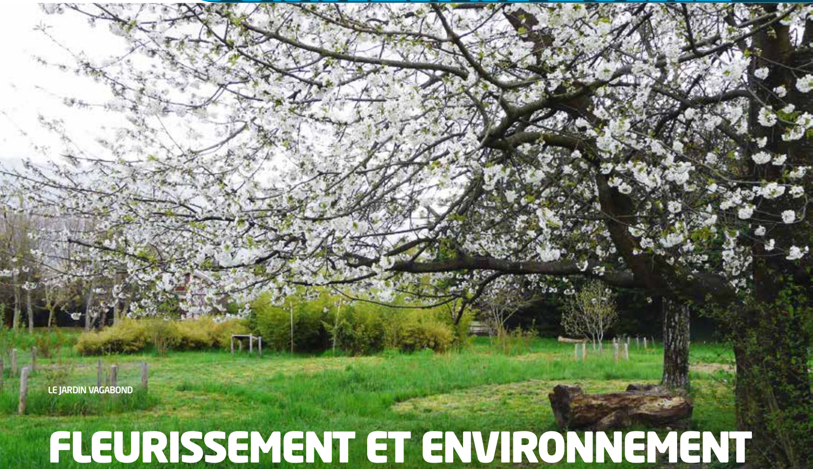
LE JARDIN VAGABOND