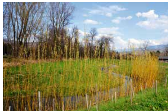
LA RECONQUÊTE DU TILLET

deux événements sont programmés. La mise en avant de la thématique « Regards » qui présentera des interprétations de l'œil. Et la célébration des 40 ans de l'obtention des 4 fleurs. Pour ce faire, cinq massifs retraçant