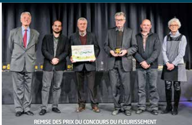
REMISE DES PRIX DU CONCOURS DU FLEURISSEMENT

l'évolution du fleurissement seront réalisés autour de l'Hôtel de Ville.