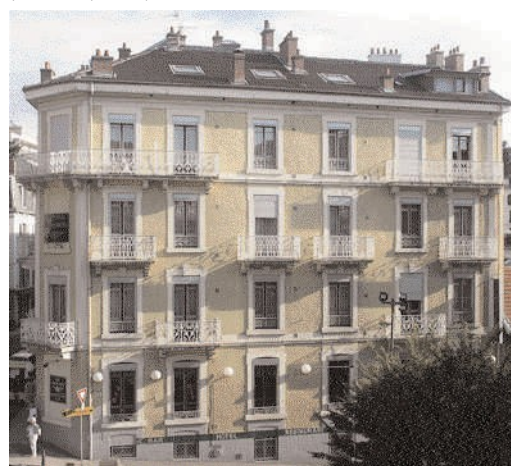
Le Windsor, encore hôtel en 2004