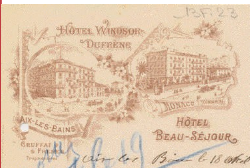
En-tête de papier à lettre de l'Hôtel Windsor vers 1884.

dortoirs et dont les lits se partageaient entre clients. Ces établissements étaient essentiellement destinés aux voyageurs ; les baigneurs, qui restaient plus longtemps, étaient logés chez l'habitant.