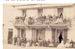
L'hôtel Guillard, hôtel de la poste, place Carnot par Demay, 1862