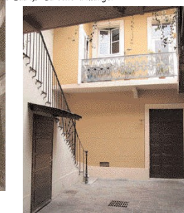
Cour intérieur de l'ancien hôtel National et de Marseille, passage de la Chaudanne