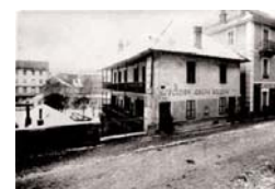
La pension Joseph Bocquin, rue Davat à la fin du XIX e siècle