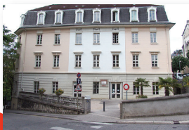
La bibliothèque ex école supérieure