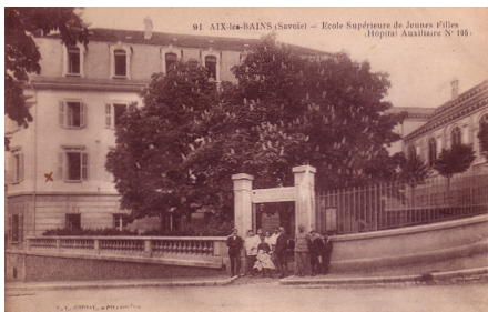
Soldat devant l'HA 105, école supérieure

Cet hôpital auxiliaire est géré par l'Union de Femmes de France. Il reçoit 45 blessés dès le premier train, le 10/9/1914. L'internat de l'école continu de fonctionner, une dizaine de jeunes filles étaient alors hébergées chez la directrice.