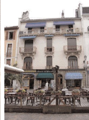
Maison Domenget, 2004