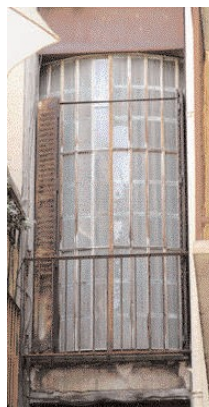
Verrière sur cage d'escalier, rue du Dauphin