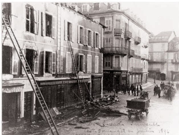
Incendie de l'immeuble Louis Domenget, place Carnot en janvier 1896.

☛ Une maison existait sur cette parcelle en 1728. Victime de l'incendie de 1739, elle a été reconstruite en alignement. En 1820, elle comportait plusieurs caves, un rez-de-chaussée et deux étages en copropriété. L'ensemble a été progressivement rassemblé par la famille Domenget à partir de 1880.