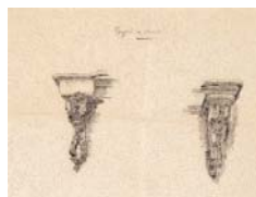
Projet de consoles par Victor Dénarié, architecte, (1896)