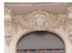
Détail du décor de façade

☛ L'immeuble, partiellement détruit lors d'un incendie en 1896, a été reconstruit par l'entreprise Léon Grosse, sur les plans de l'architecte chambérien, Victor Dénarié. Celui-ci s'est appuyé sur la partie arrière, rue du Dauphin, qu'il a surélevée et couverte d'un toit brisé. Il a conservé la totalité du rez-de-chaussée avec son escalier en pierre éclairé par une courette, mais a modifié la distribution intérieure et reconstruit l'escalier à partir du 1 er étage.