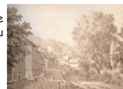
L'entrée de la ville côté porte de Genève. Sépia, Turpin de Crissé, 1809