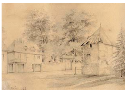
La Tour Ferrollet (Perret), place du Revard. Aquarelle, Denin, 1852

La gravure du Theatrum Sabaudiae semble indiquer un nombre total de 12 tours ou tourelles, mais seules six sont formellement attestées :