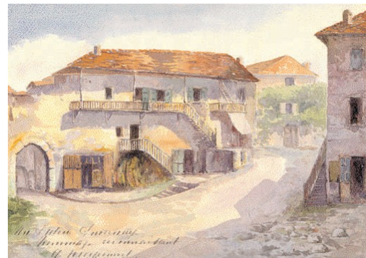
Reconstitution de la porte de Mouxy, aquarelle de G. Meyrmet, 1925