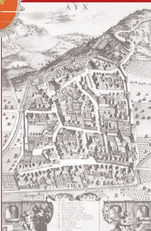
Theatrum Sabaudiae. Dessin de G.T. Borgonio, 1674

Le rempart de la ville est représenté de manière fantaisiste sur la gravure du Theatrum Sabaudiae , mais l'on peut en reconstituer le tracé de manière plus précise grâce au plan du cadastre sarde de 1728. Aucune datation scientifique n'est proposée pour sa construction. Les historiens penchent pour un enfermement de la ville dès la fin de l'Empire romain dans le but de se protéger des invasions germaniques du IV e siècle de notre ère.