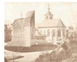
Ruine de la Tour du Château. Photographie, fin XIXe