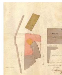
Plan pour l'aménagement de la rue de Chambéry. Pellegrini, 1856

Le rempart de la ville est représenté de manière fantaisiste sur la gravure du Theatrum Sabaudiae , mais l'on peut en reconstituer le tracé de manière plus précise grâce au plan du cadastre sarde de 1728. Aucune datation scientifique n'est proposée pour sa construction. Les historiens penchent pour un enfermement de la ville dès la fin de l'Empire romain dans le but de se protéger des invasions germaniques du IV e siècle de notre ère.