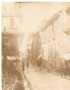
La rue des Bains avant son élargissement. Photographie fin XIX e siècle.

Après le grand incendie de 1739, l'ingénieur Garella dessina le premier projet d'alignement de cette rue, qui impliquait le déménagement des boucheries et le déplacement des moulins. Aucun autre élément significatif de ce plan ne put être mis en œuvre avant 1844, date à laquelle une souscription publique finança l'achat des maisons nécessaires à l'alignement du côté sud de la rue.