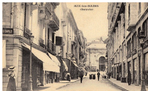
L'entrée de la rue. Carte postale. Ed. LL vers 1914.