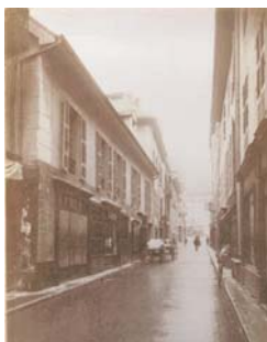
La rue des Bains prise la place. Photographie fin XIX e siècle.

Après la réalisation de la rue du Casino, en 1853, la Ville décida de prolonger la rue des Bains pour faire communiquer la place Centrale et la nouvelle rue. Les plans pour la reconstruction des façades avaient été confiés à l'architecte Pellegrini qui dessina des portiques, de chaque côté de cette rue, inspirés de l'architecture de l'Italie du nord.