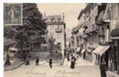
L'entrée de la rue et l'Hôtel de l'Arc Romain. Carte postale vers 1890.

Un nouvel élargissement de la partie amont de la rue des Bains, la faisant passer de 6 à 10 mètres, fut initié en 1905-1906 lors de la construction de l'hôtel Astoria et poursuivi en 1910, lors de la construction des annexes de ce même hôtel.