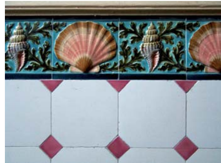
Ancien hôtel Bernascon, 1897. Détail de céramique murale