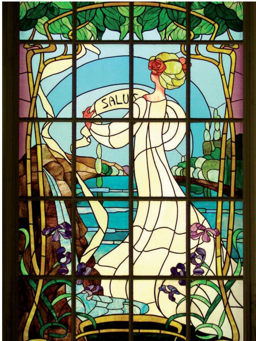
Ancien hôtel Excelsior, 1906. Vitrail de la cage d'escalier