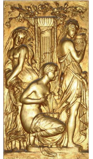
Salon de l'ancien hôtel Splendide, 1906. Bas-relief, allégorie de la beauté