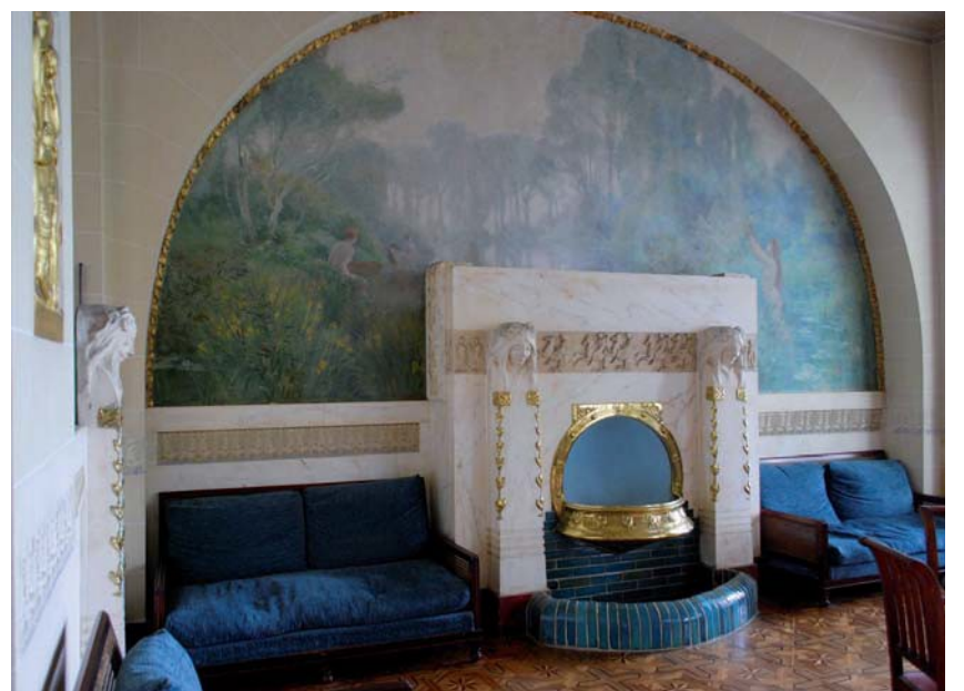
Salon de l'ancien hôtel Splendide, 1906. Fontaine et peinture murale, "Le bain dans la rivière", Clermont et Brosset, Genève.

Le thème de l'eau est encore présent dans les années 30. Les mouvements de courbes du jet d'eau ou de la