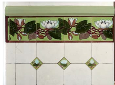
Ancien Grand-Hôtel d'Aix, 1857-1898. Détail de céramique murale

La faune et la flore aquatiques viennent enrichir cette image. Dans les grands hôtels, l'influence de l'Art nouveau sème sur les décors de céramique, matériau qui convient particulièrement aux salles d'eau, des motifs de libellules, de coquillages, d'algues et de nénuphars.