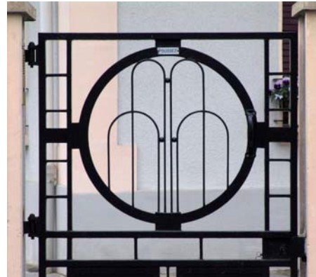
Maison, 25 rue Jean-Jaurès. Portail