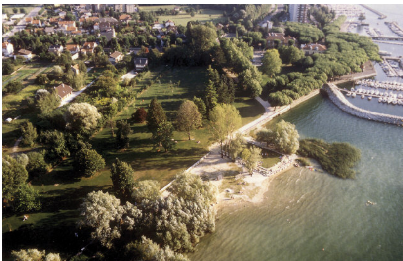
Le site transformé en espace naturel par le ^ Conservatoire de l'espace littoral et des rivages lacustres après 1982. (AC Aix-les-Bains)